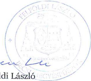
Felföldi László pécsi megyéspüspök